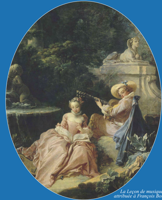
La Leçon de musique, attribuée à François Boucher

VENDREDI 31 MAI ET SAMEDI 1 ER JUIN 2013 10H00 - 20H00 Centre Malesherbes - Sorbonne