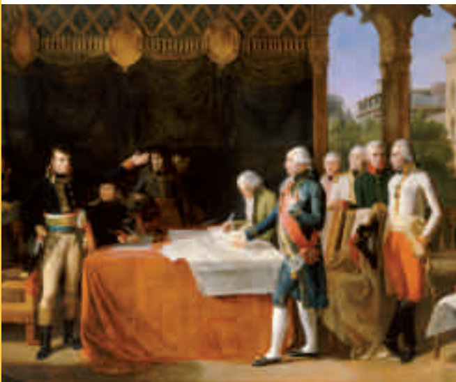
Signature des préliminaires de paix au château d'Ekward Lethière Guillaume Guillon

SAMEDI 1 ER FEVRIER 2014 (sur inscription)