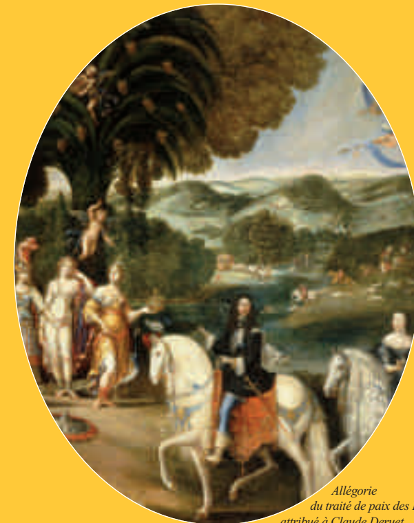
Allégorie du traité de paix des Pyrénées attribué à Claude Deruet