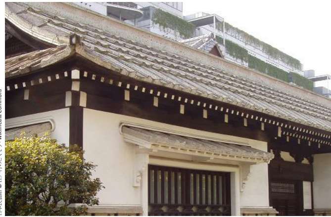
日本建築