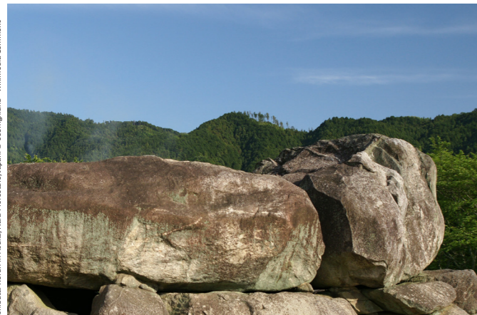
Ishizaki Kofun in Asuka, Nara Prefecture, Japan