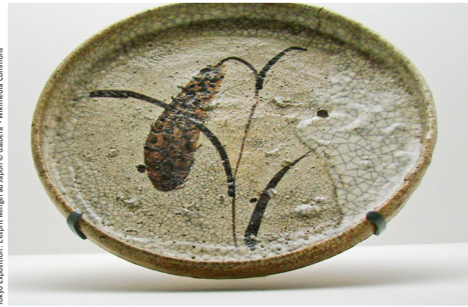
Tokyo Exposition: L'esprit Mingei au Japon

Dernière matinée à Tokyo consacrée au musée Mingei .