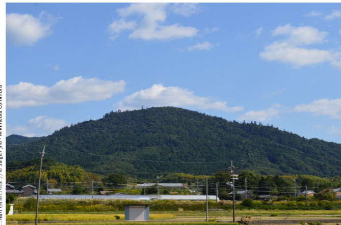
三輪山 (奈良県天理市)

Une belle journée de découverte des paysages ruraux japonais avec une excursion dans les villes d'Asuka et Yoshino. Asuka dans la matinée nous servira d'introduction à l'archéologie japonaise. Nous partirons à la découverte des anciennes tombes kofun (datées d'entre le III e et le VII e siècle) de Makimuku , d' Ishibutai et de Kitora .