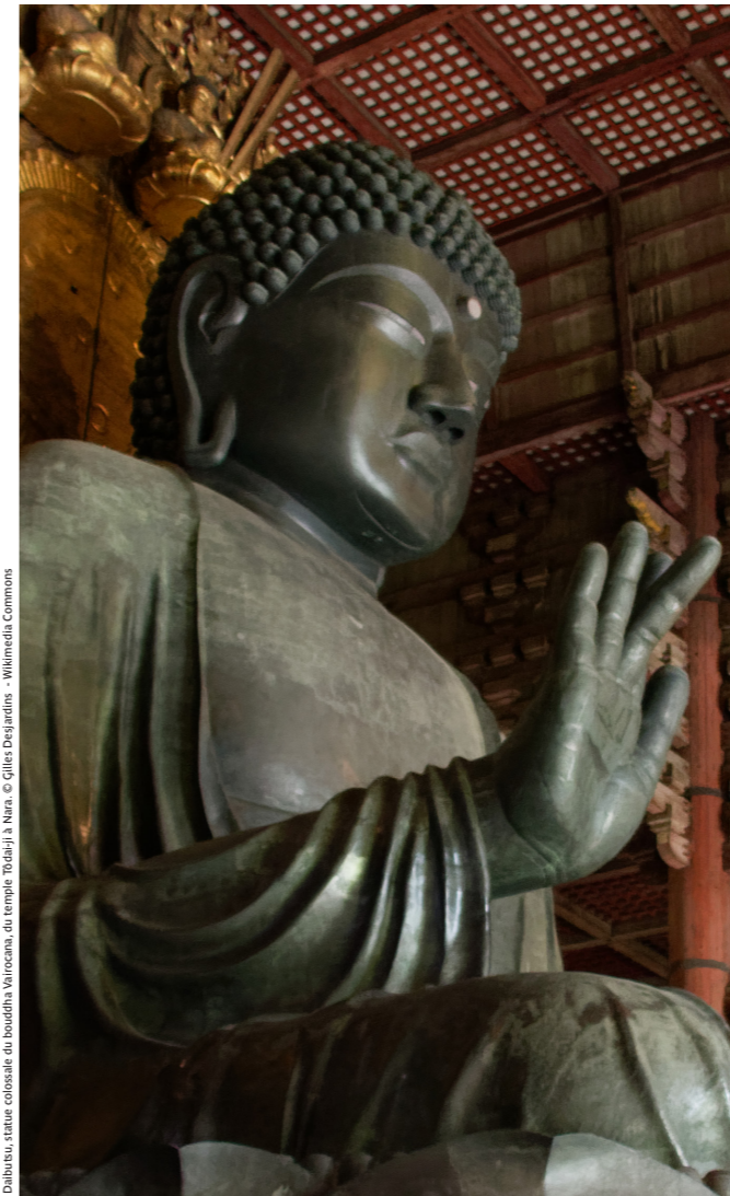
Daibutsu, statue colorée du bouddha Vairocana, du temple Tōdai-ji à Nara