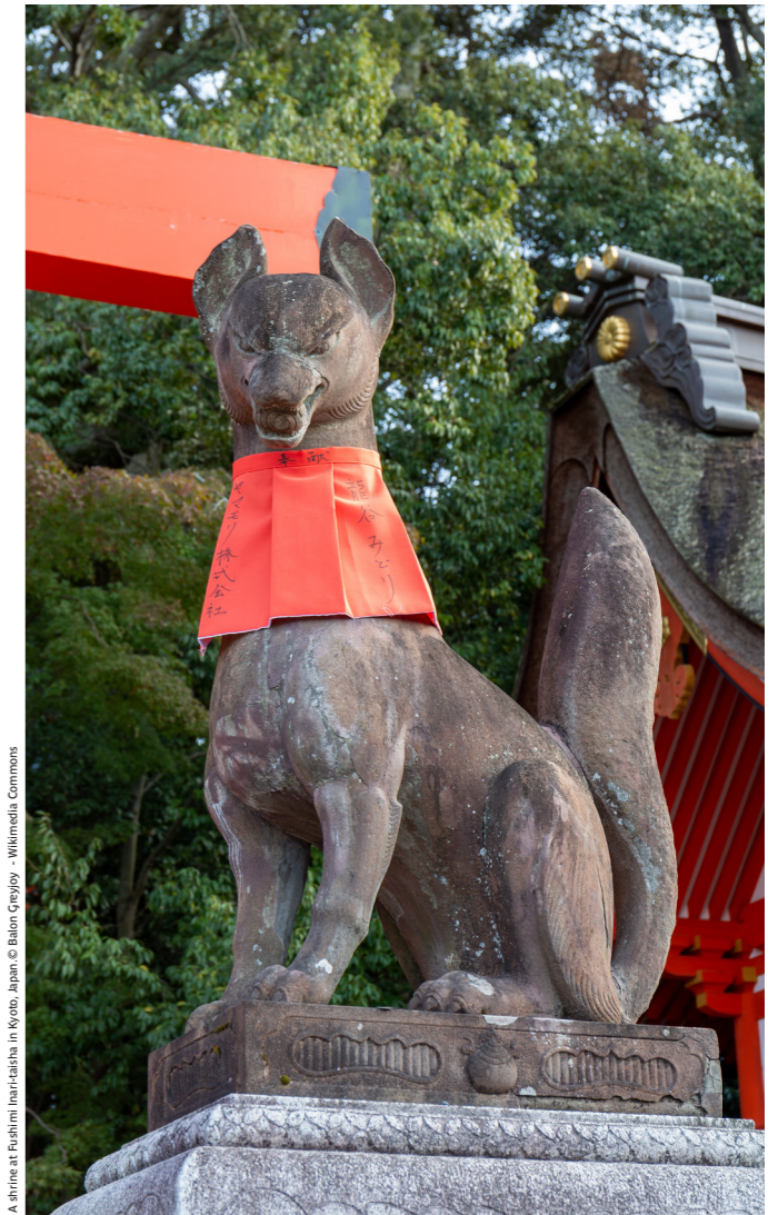
A shrine at Fushimi Inari-taisha in Kyoto, Japan

Après une visite du temple bouddhiste Sanjūsangen-dō à Kyoto, cap sur les paysages vallonnés de la région, ponctués par d'impressionnants sanctuaires comme Fushimi ainsi que par l'ancienne capitale Nara. On prend ici le pouls du vieux Japon, où se côtoient de nombreux temples qui attestent de l'essor du bouddhisme. Nous visiterons entre autres le plus grand temple en bois du monde Tōdai-ji , et son célèbre Grand Bouddha Daibutsu , ainsi que Nigatsudō et Sangatsudō , typiques de l'ère Tenpyō . En fin d'après-midi, nous ferons une halte au sanctuaire Fushimi , haut lieu shintoïste où les impressionnants torii vermillons s'alignent à perte de vue.