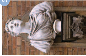
Dame romaine Vdse 155