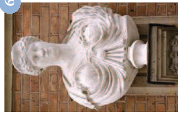
Dame romaine Vdse 156