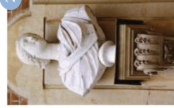
Dame romaine Vdse 128