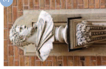
Caracalla Vdse 129