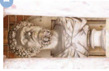
Septime Sévère Vdse 93