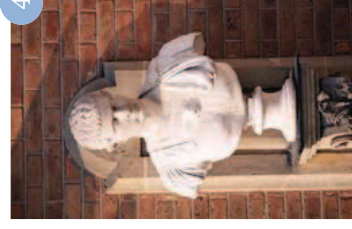
Empereur romain Vdse 150