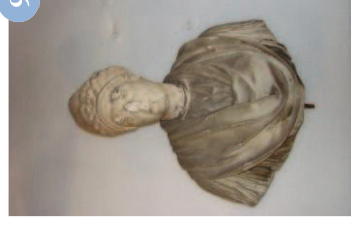
Dame romaine MV 7508