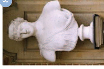
Diane Vdse 159