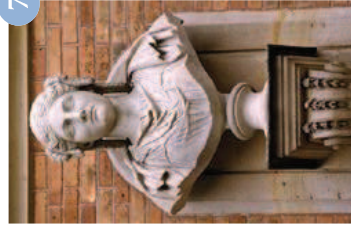
Dame romaine Vdse 157