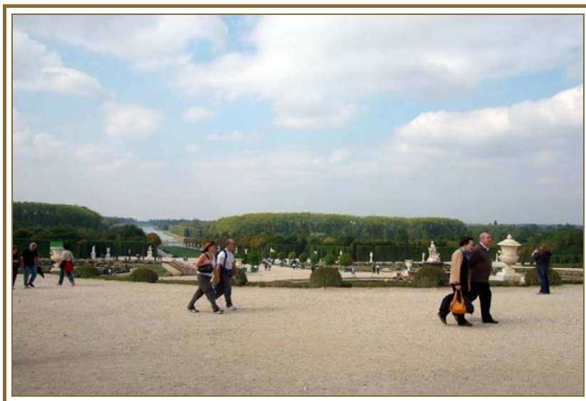
Vue depuis votre banc du bassin de Latone et du Grand Canal