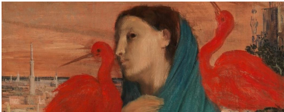
Edgar Degas, Jeune femme à l'ibis , 1857-58, The Metropolitan Museum of Art, New York

Manet / Degas (jusqu'au 23 juillet 2023)