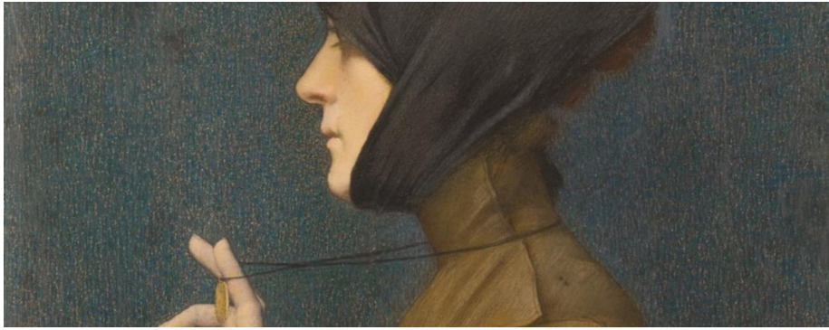
Lucien Lévy-Dhurmer, La Femme à la médaille , en 1896, Musée d'Orsay

Le musée d'Orsay expose ce printemps 2023 une centaine des pastels de sa collection, riche d'environ 500 œuvres. La dernière exposition de cette ampleur consacrée aux pastels du musée, « Le Mystère et l'éclat », date de 2009. Cette nouvelle présentation permettra au public de découvrir ou de redécouvrir ces joyaux de la collection où brillent les œuvres de Millet, Degas, Manet, Cassatt, Redon, Lévy-Dhurmer et bien d'autres.